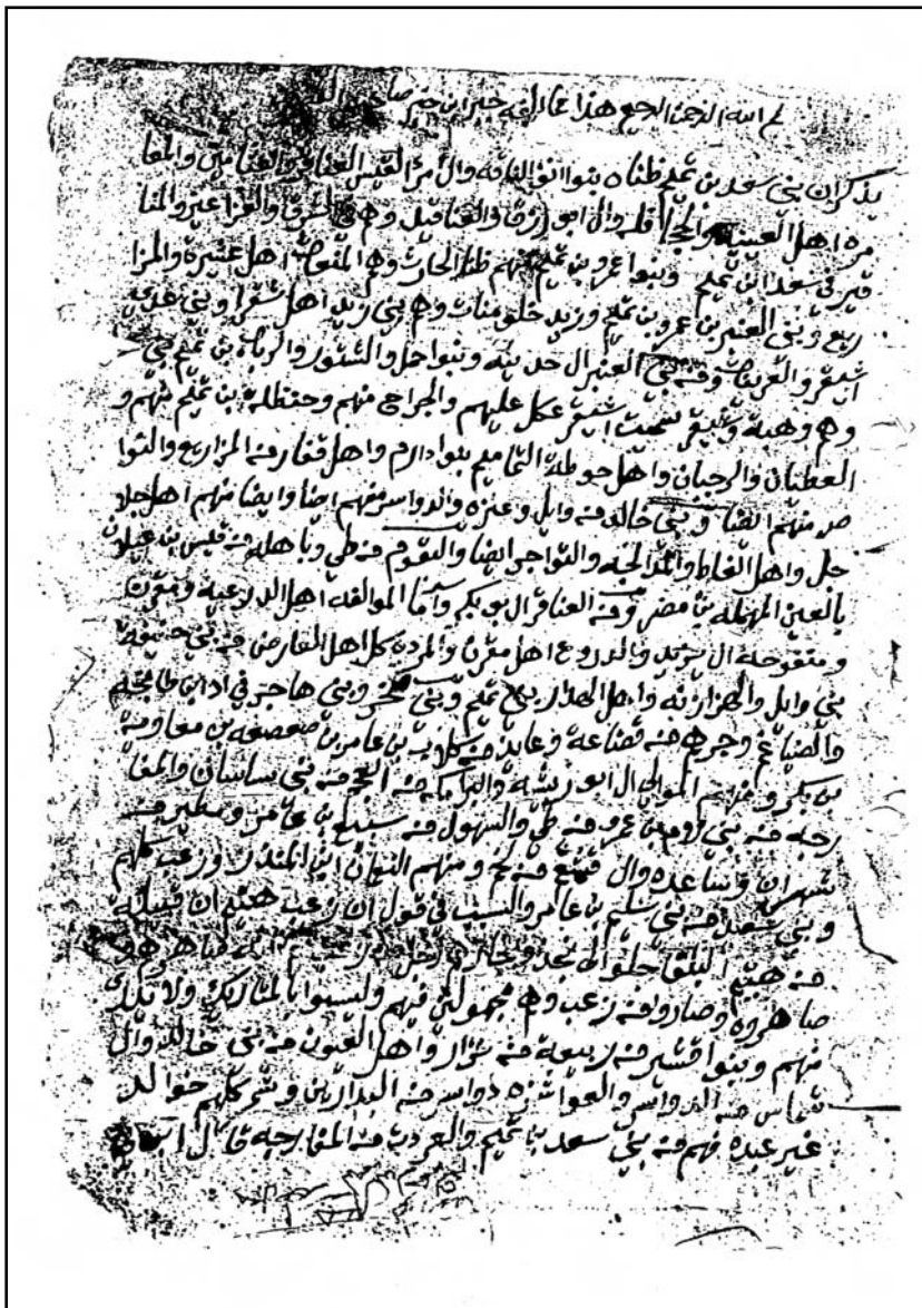
الصفحة الأولى من النسخة (١-ب)