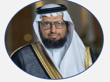
السيرة الذاتية للدكتور عبد العزيز بن سعد الدغيث